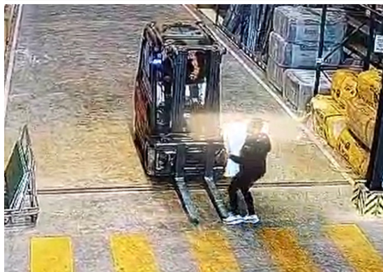
Vorfall Nr. 2: Mitarbeiter bricht sich mehrere Knochen im Fuß

Ein Mann, der eine Last trug, die seine Sicht behinderte, betrat das Lager. Ein vorbeifahrender Gabelstapler hielt unter Einhaltung der 2-Meter-Regel an.