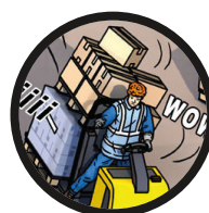
5. Réduire la vitesse est plus sûr pour tout le monde.