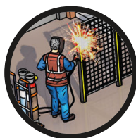
3. Le travail à chaud nécessite un permis de feu.