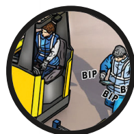
2. Utilisation dangereuse du téléphone portable.