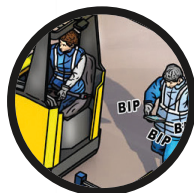
2. Uso pericoloso del cellulare.