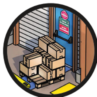
4. Uscita di emergenza bloccata: evacuazione in caso di incendio.