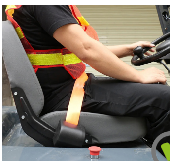
Uso correcto del cinturón de seguridad