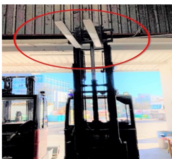
Causa del accidente