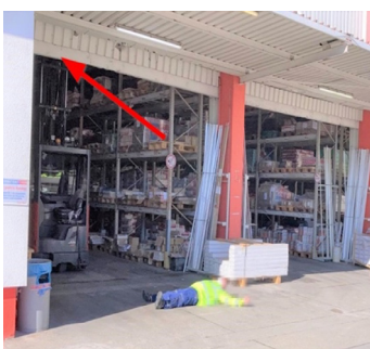
Resultado do acidente