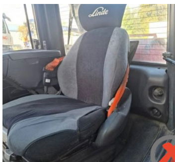
Utilização incorrecta do cinto de segurança