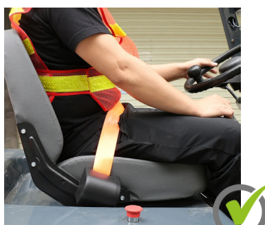
Utilização correcta do cinto de segurança