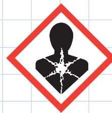
Risque pour la santé