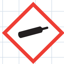
Gaz sous pression