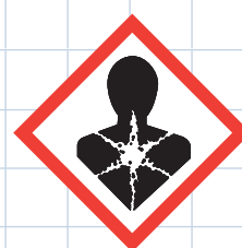
Pericoloso per la salute